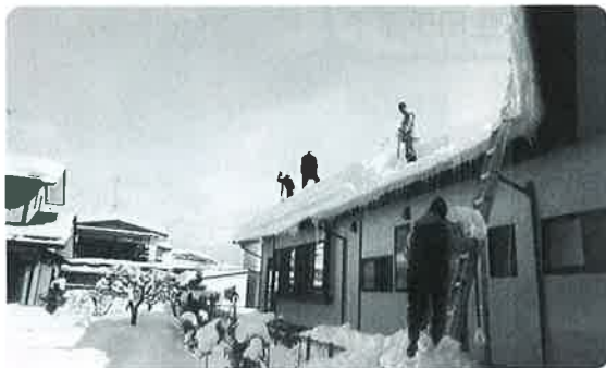
地区民の生活を支えるためのボランティア活動(除雪)

でも、何より、『まずは、自分たちが楽しむことを考えよう！』と、その思いを大切に活動しています。