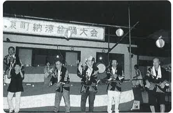
地域を盛り上げるための行事への参加

しかし、年代層ごとのヨコの組織の加入状況が必ずしも十分でない団体もある上に、中核となるべき壮年層の組織化がされていませんでした。そこで、壮年層を結集して『ゆうゆう会』を立ち上げました。