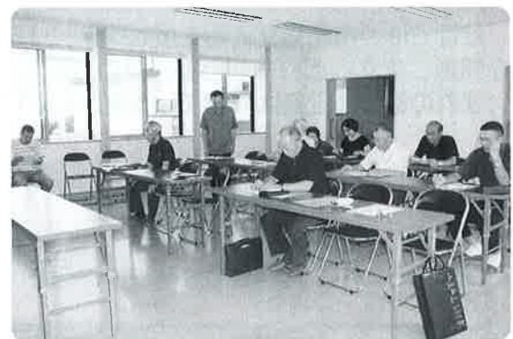
豊かな地域づくりを目指しての研修

☆地区内でのつながりが薄くなっている中、地区内の組織と連携し、新たなつながりをつくる取り組みは、互いに良い影響を与えてよりよい活動につながるのではないのでしょうか。