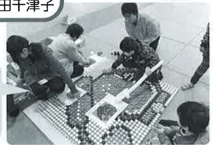
*チャレンジコーナー*