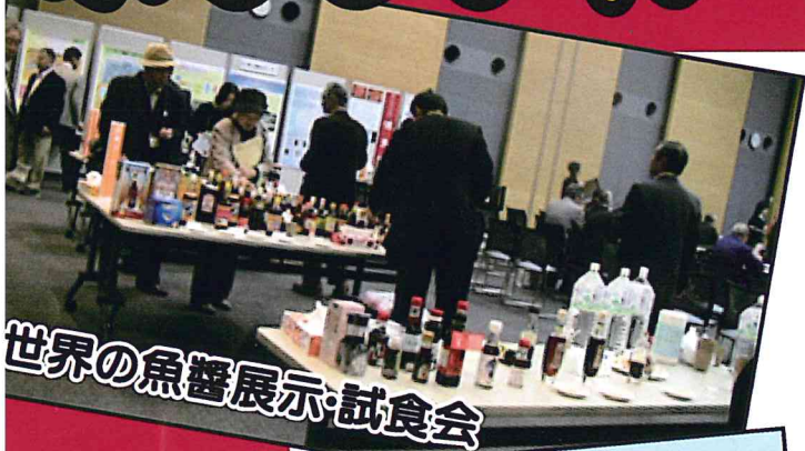
世界の魚醤展示・試食会