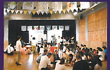
東北芸術工科大学 キッズアートキャンプ