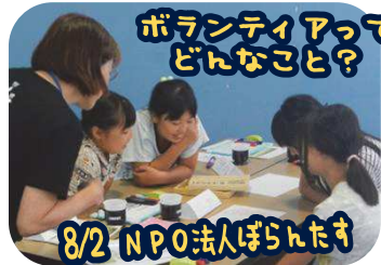
ボランティアって どんなこと？

夏ボラ番外編として、小学5年生から大人までいっしょに学ぶ学習会メニューを3つ行いました。