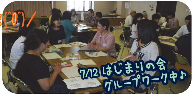
7/12 はじまりの会 グループワーク中♪

参加された方からは「楽しく参加できました」「グループワークで色々な人の考えを聞いてよかったです」「ヤル気がUP↑しました」などのご感想をいただきました。