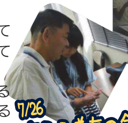
7/26 盲ろう者友の会 手のひら書き体験中♪

「もっと難しいと思って いたけど、覚えやすくて 楽しかった。（手話）」 「みんなのためになると、 みんなうれしくなるから ボランティアをやってみ たい。（ぼらんたす）」