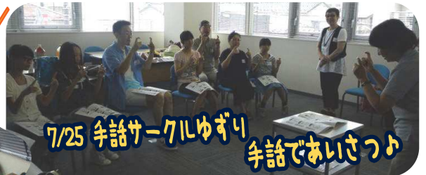
7/25 手話サークルゆずり 手話であいさつ♪

「盲ろうの方と接し貴重な体験ができました。もっと色々知りたいと思いました。（盲ろう者友の会）」などのご感想をいただきました(^o^)/